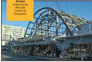
Así luce el deteriorado Mercado Central de Concepción.