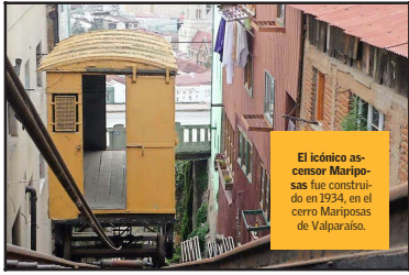
El ícono ascensor Mariposas fue construido en 1934, en el cerro Mariposas de Valparaíso.