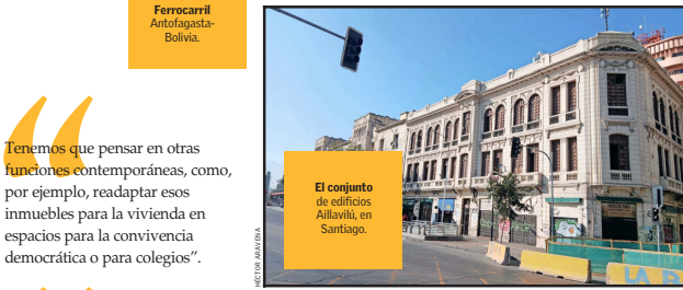
El conjunto de edificios Aillavilú, en Santiago.

La falta de uso también implica un deterioro en la conservación de los edificios. Para nosotros hablar de abandono es hablar también de un abandono social”.